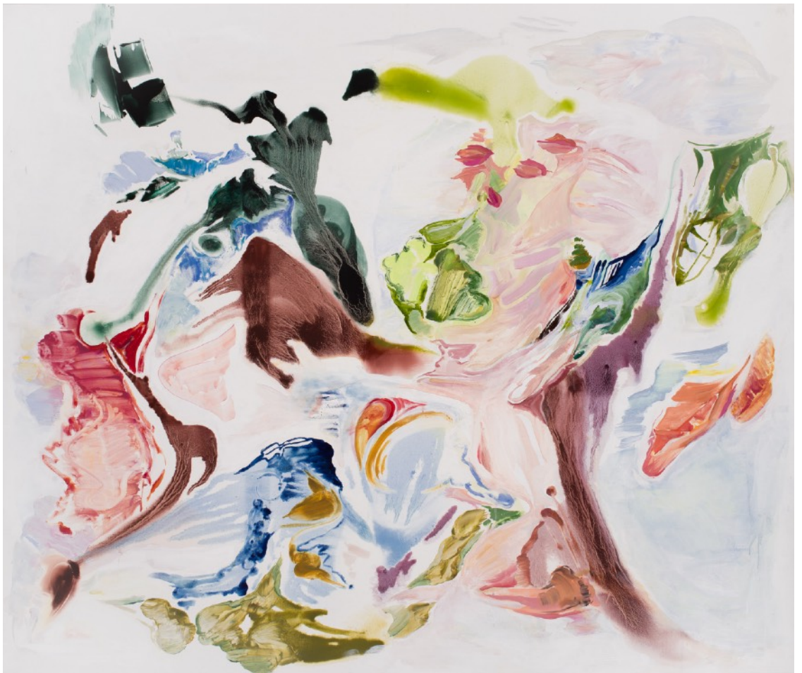
Cartografías emocionales VI, 2024 Óleo sobre tela 154 x 184 cm