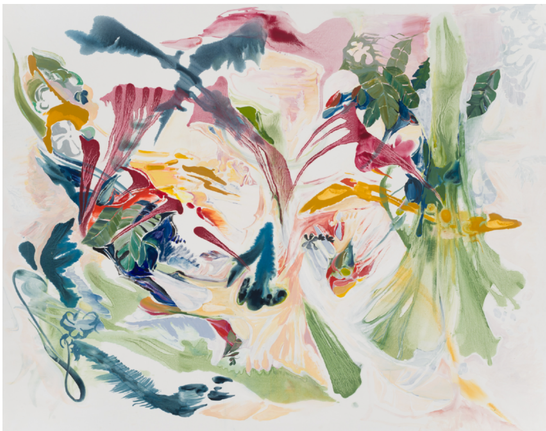
Cartografías emocionales III, 2024 Óleo sobre tela 154 x 196 cm