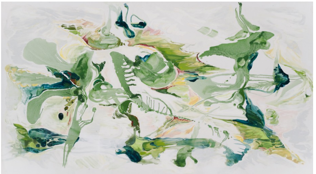
Cartografías emocionales IV, 2024 Óleo sobre tela 110 x 198 cm