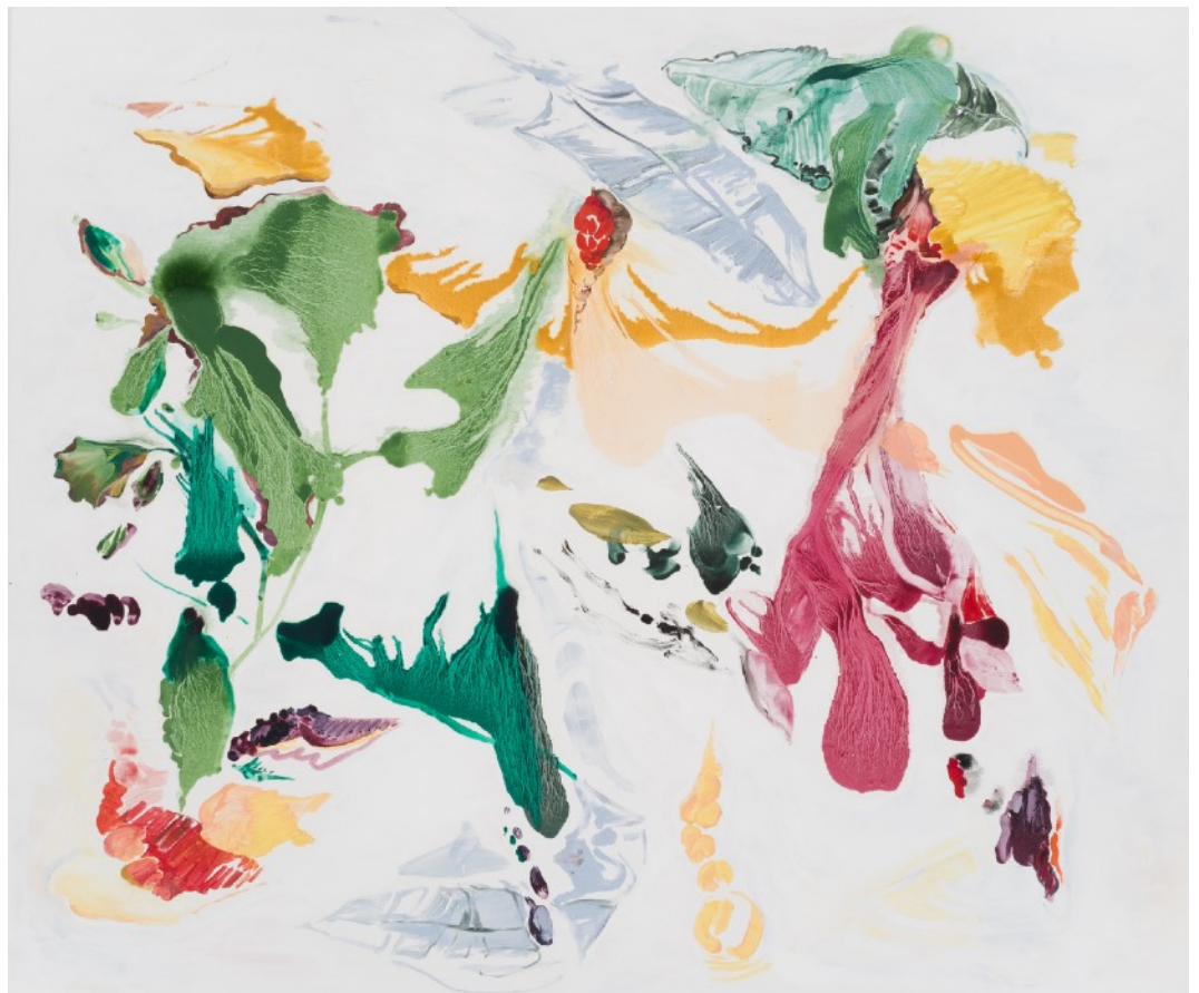
Cartografías emocionales II, 2024 Óleo sobre tela 154 x 184 cm