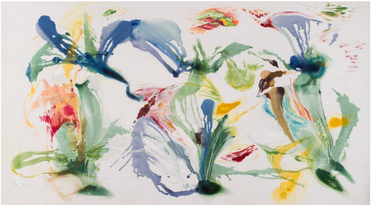
Cartografías emocionales I, 2024 Óleo sobre tela 110 x 199 cm