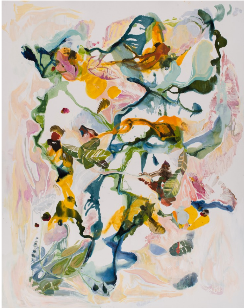
Cartografías emocionales VII, 2024 Óleo sobre tela 196 x 153 cm