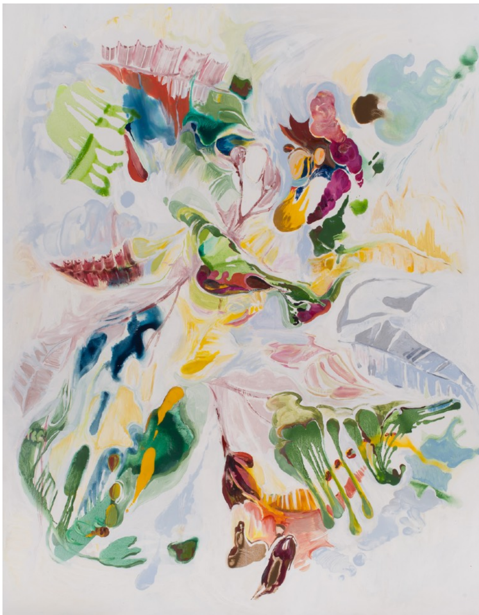
Cartografías emocionales V, 2024 Óleo sobre tela 196 x 155 cm