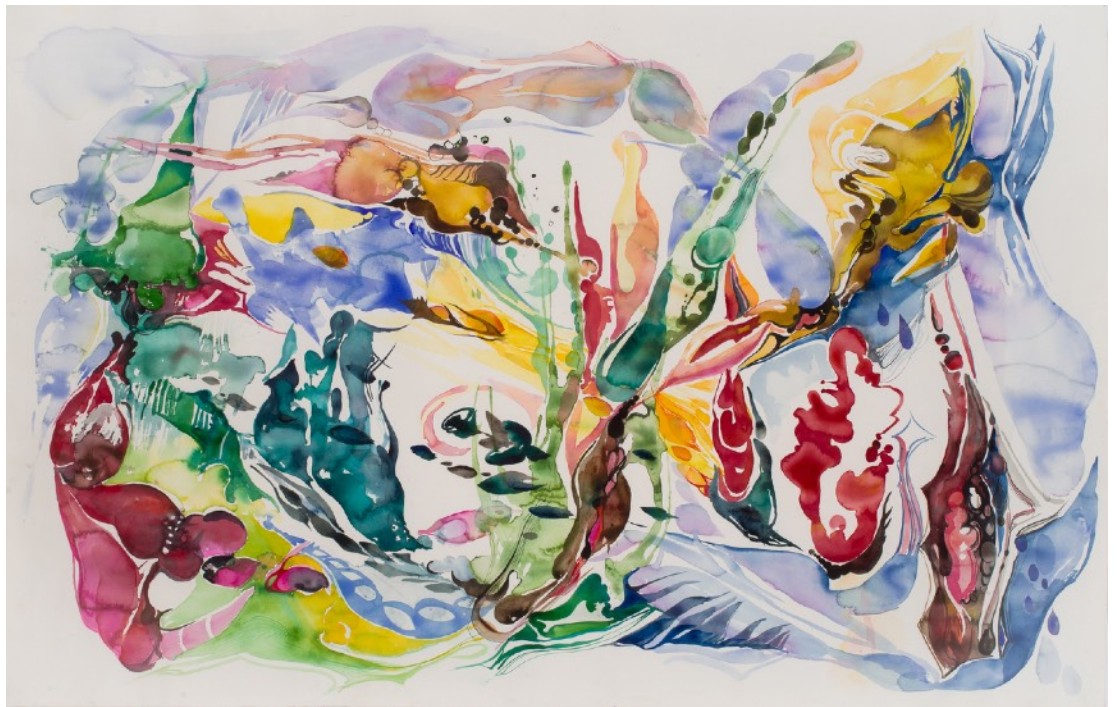
Cartografías emocionales VIII, 2024 Óleo sobre tela 125 x 188 cm