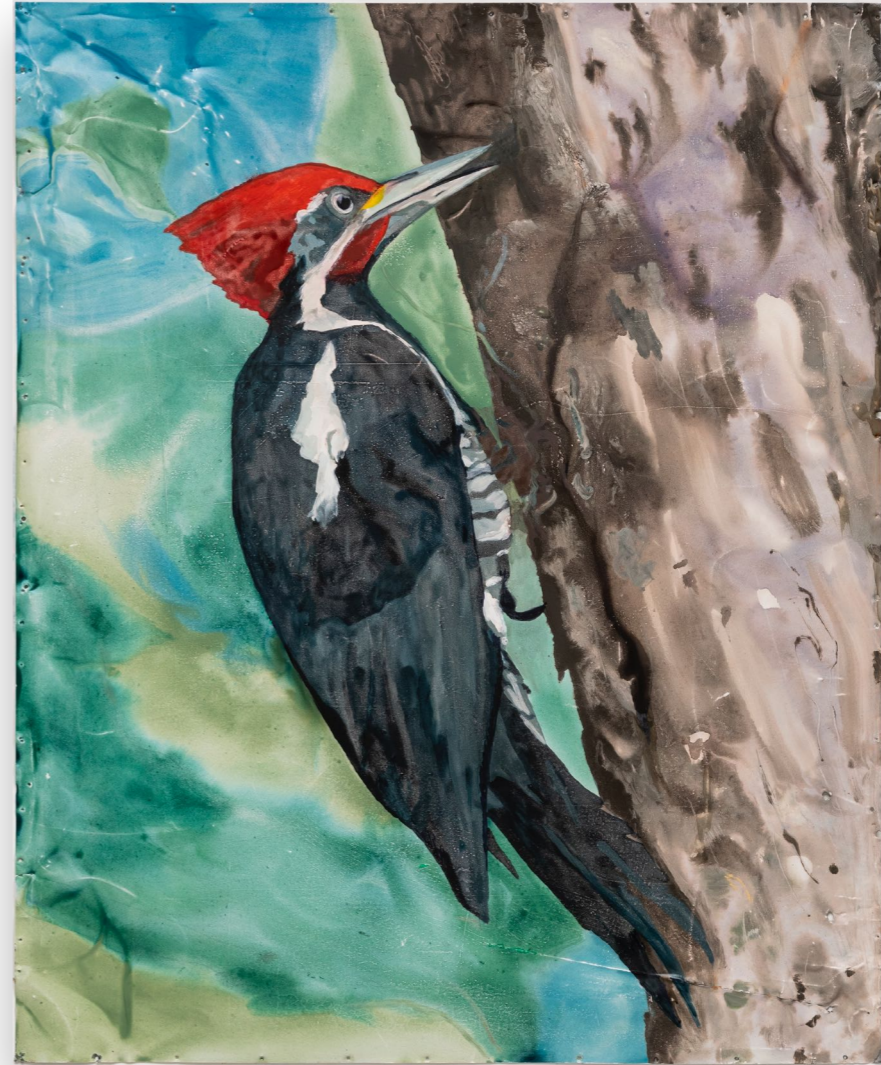
Serie pájaros (2022) Carpintero Esmalte sintético sobre chapa 122 x 100 cm