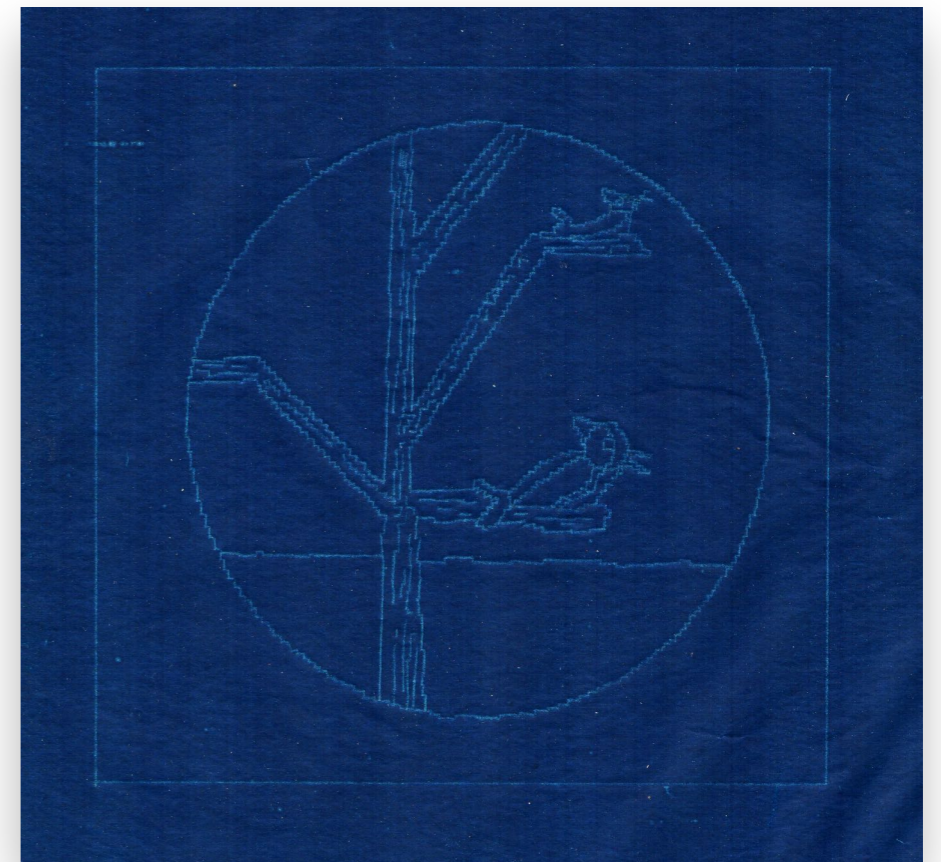
Pajaritos (1999) Dibujo sobre papel carbónico 29 x 34 enmarcada | 15 x 15 cm sin enmarcar