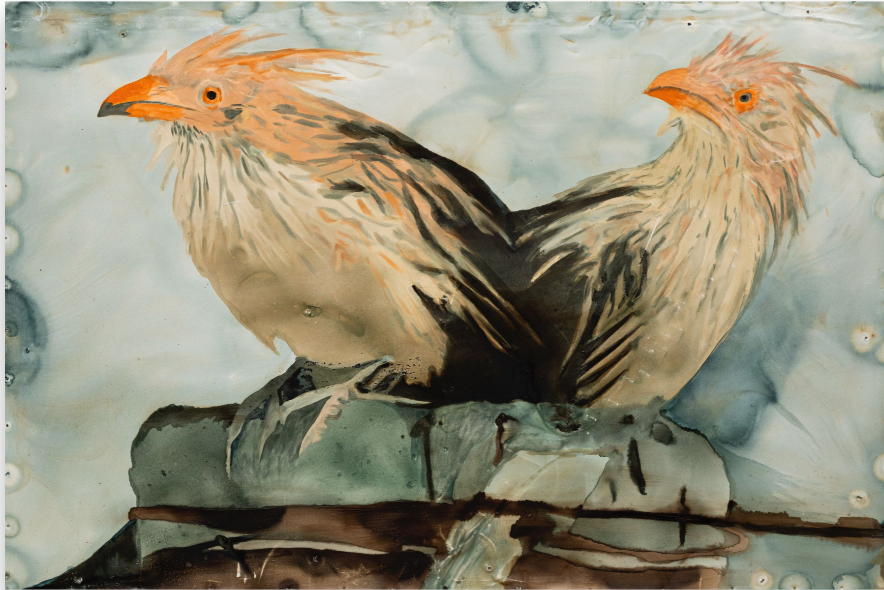
Pirinchos (2022) Esmalte sintético sobre chapa 100 x 150 cm