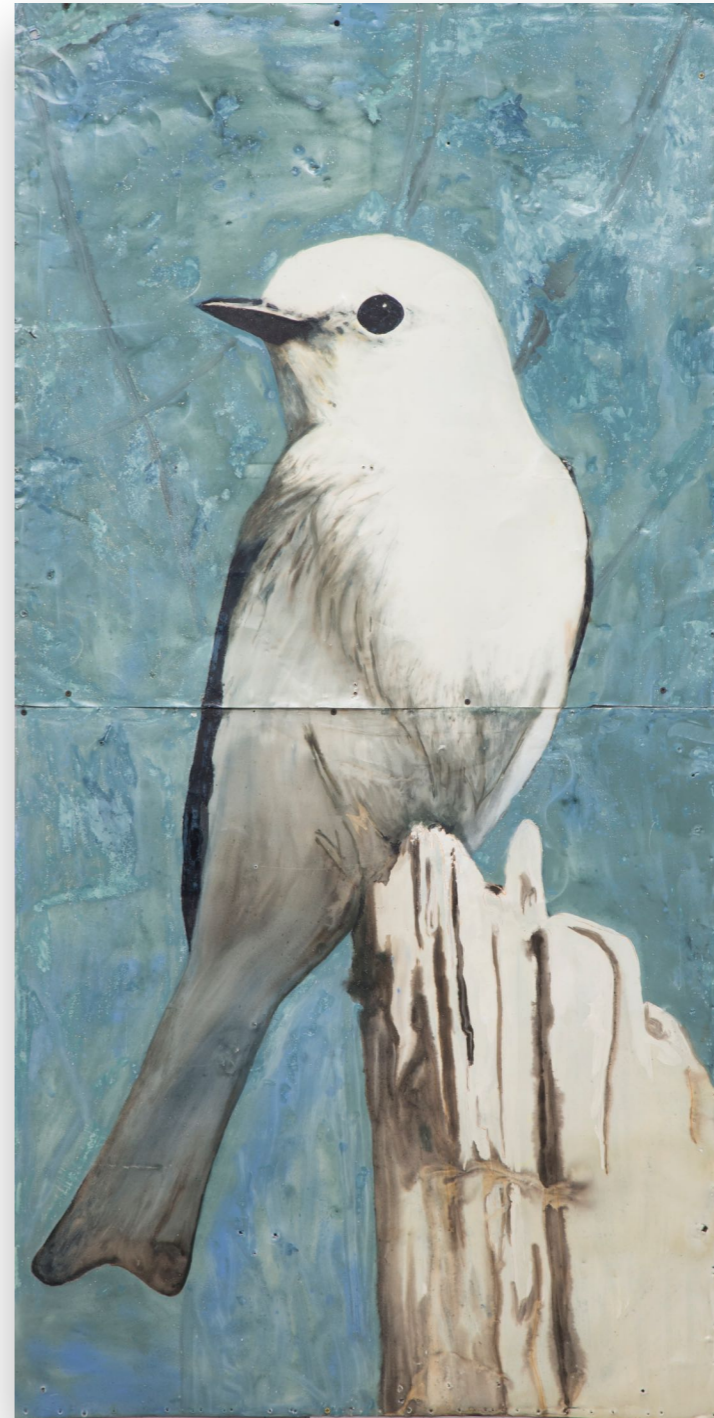
Serie pájaros (2021) Colibrí negro - Monjita Esmalte sintético sobre chapa 200 x 100 cm