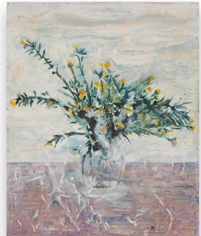
Daisys (2023) Esmalte y oleo sobre chapa 122 x 100 cm