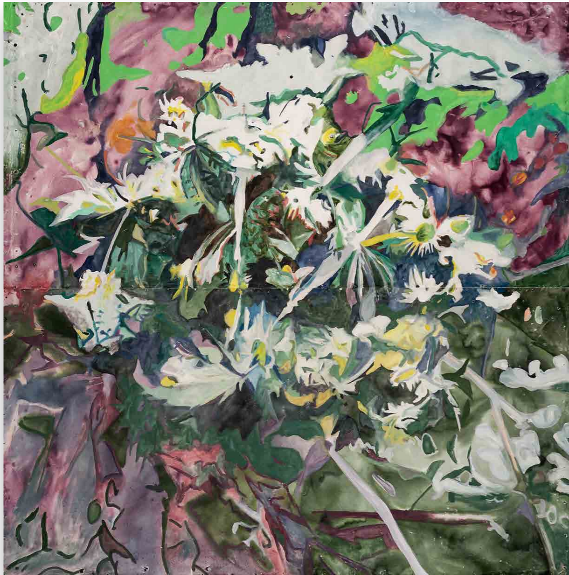
Wild Carrots. (2021) Esmalte y oleo sobre chapas esmaltadas 150 x 150 cm