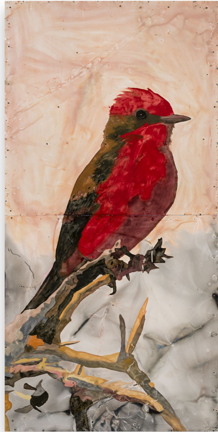
Serie pájaros (2022) Benteveo al palo | Churrinche Esmalte sintético sobre chapa 200 x 100 cm