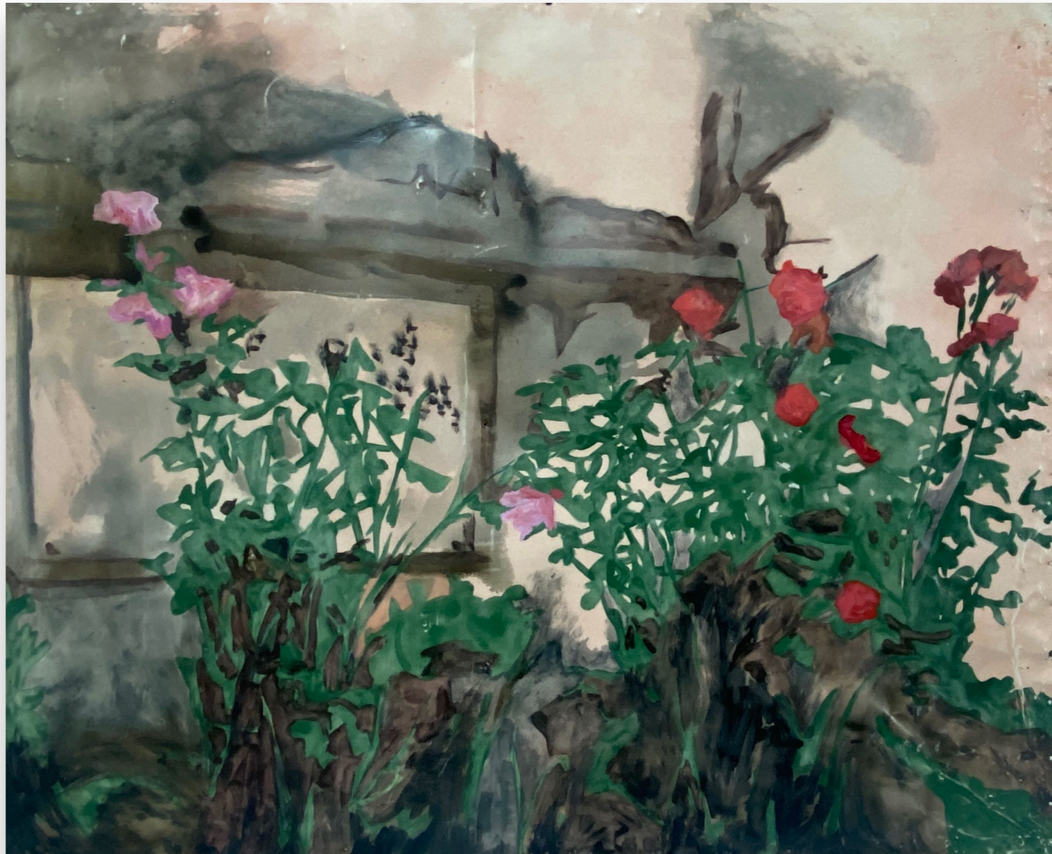
Flores balcarceñas 2 (2022) Esmalte y oleo sobre chapa 100 x 122 cm