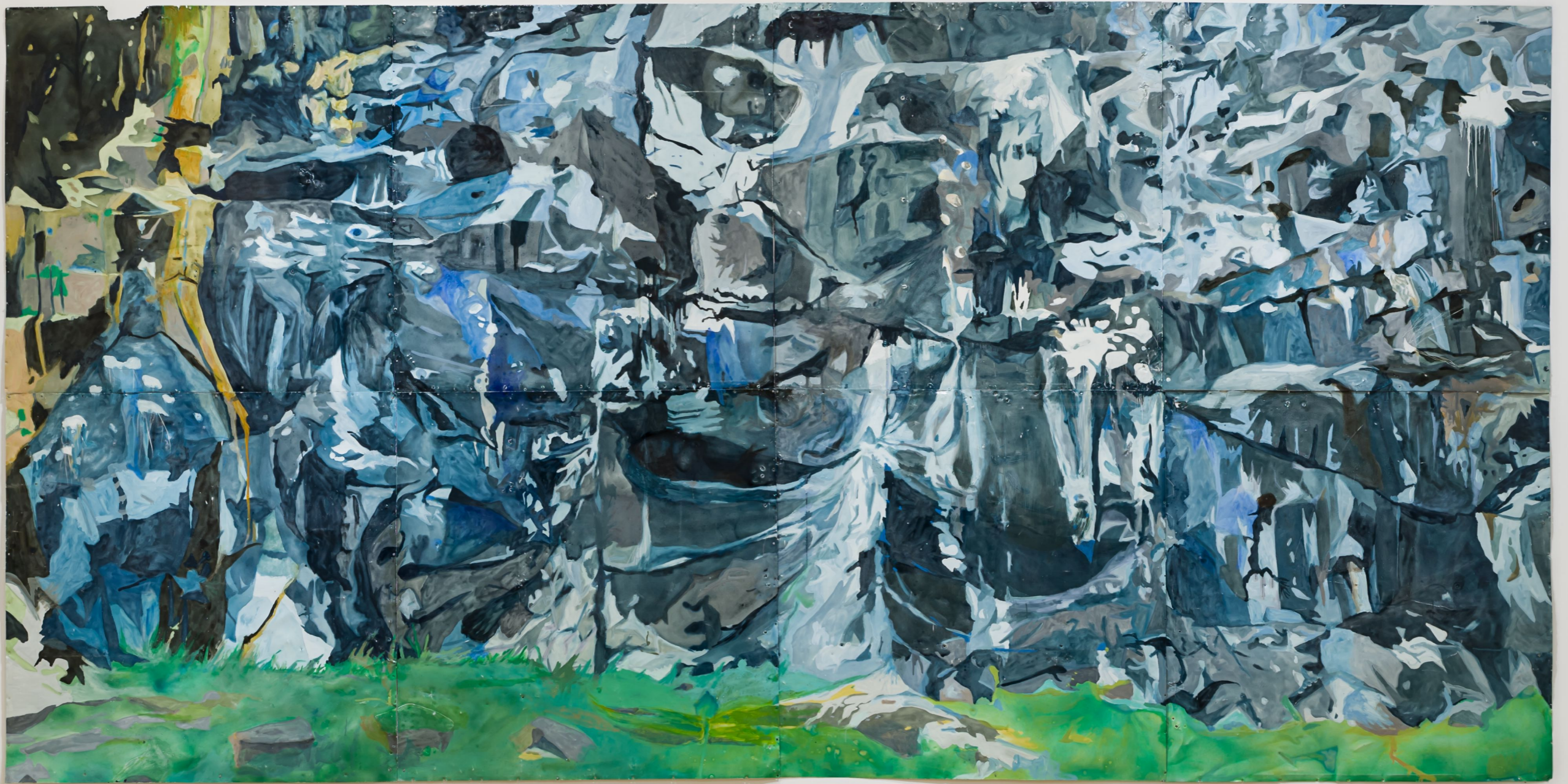
Cerrito , 2022 Esmalte sintético sobre chapa 200 x 400 cm