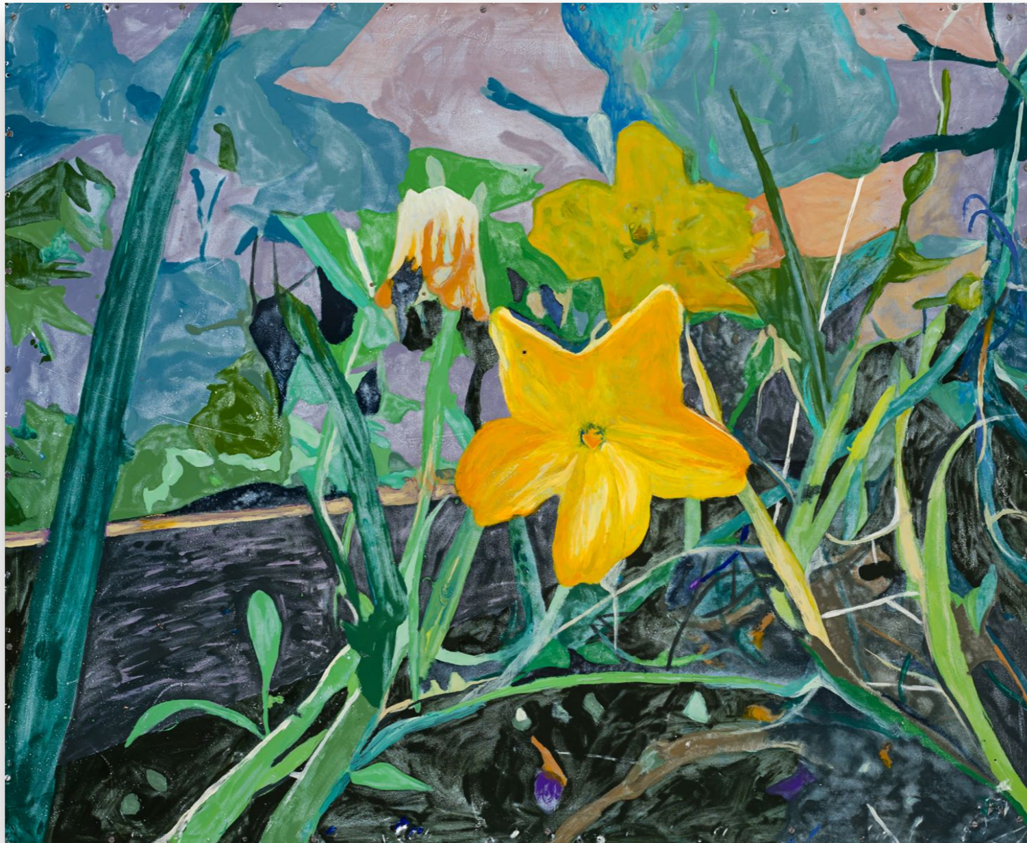
Zucca a casa (2023) Esmalte y oleo sobre chapa 100 x 122 cm