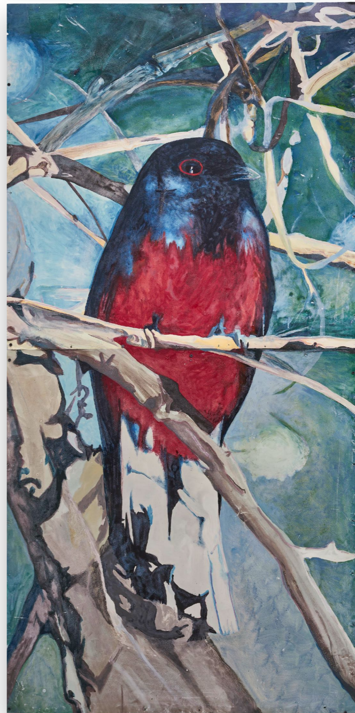
Serie pájaros (2021) Federal - Surucúa Esmalte sintético sobre chapa 200 x 100 cm