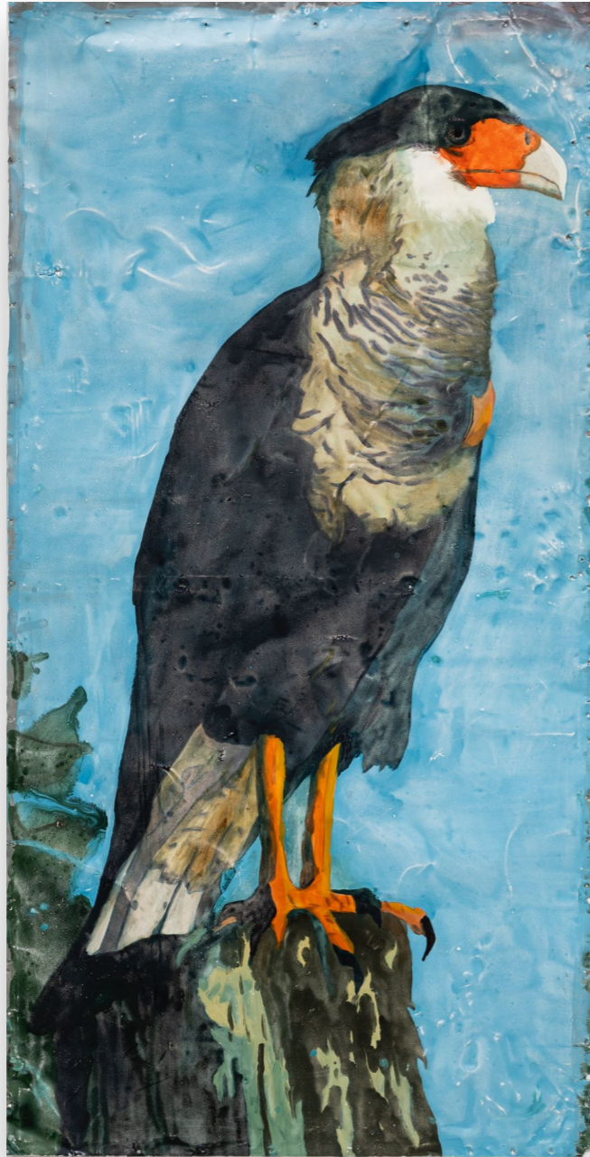
Serie pájaros (2022) Carancho Esmalte sintético sobre chapa 150 x 75 cm