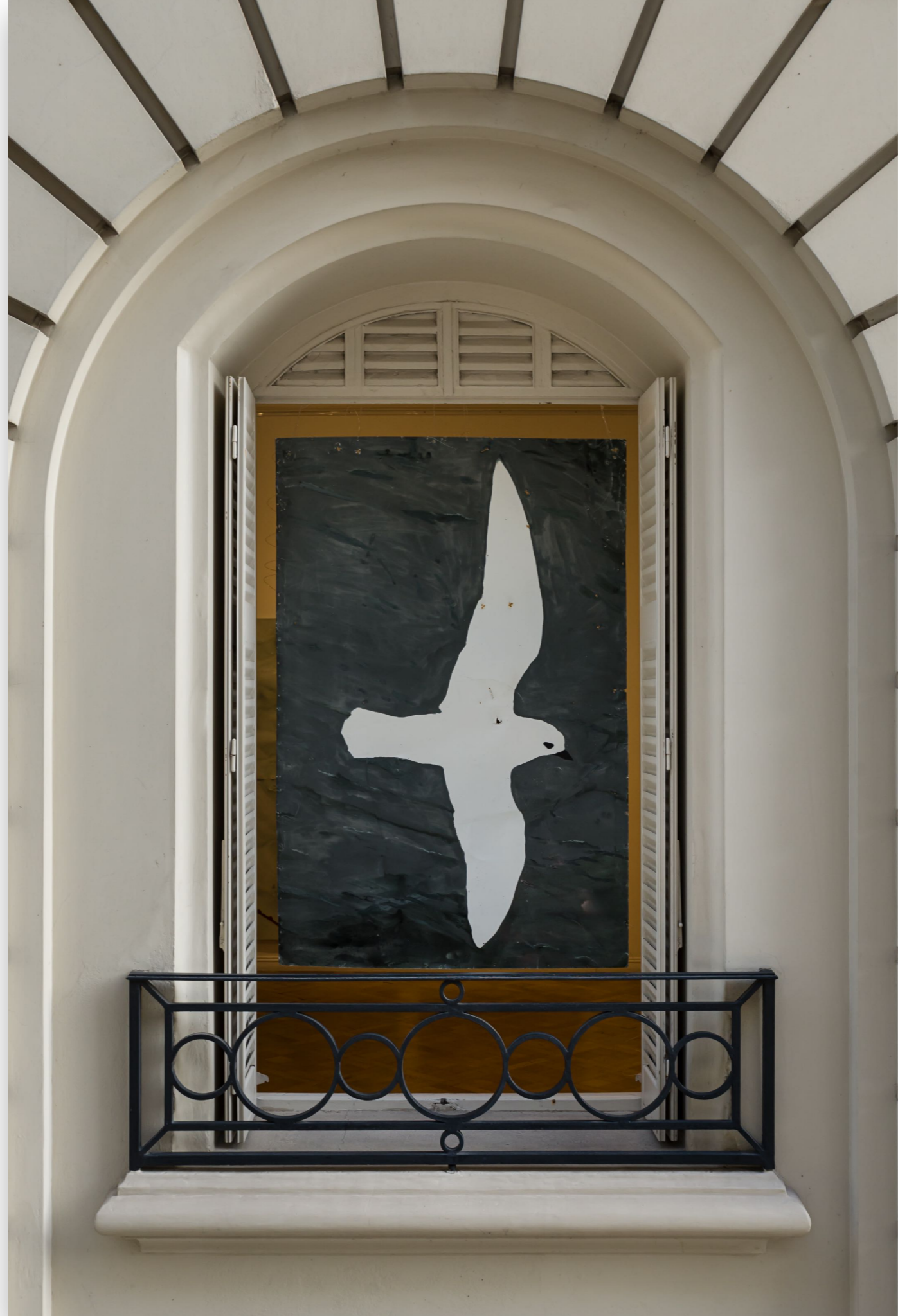
Serie pájaros (2021) Caviota Esmalte sintético sobre chapa 150 x 100 cm