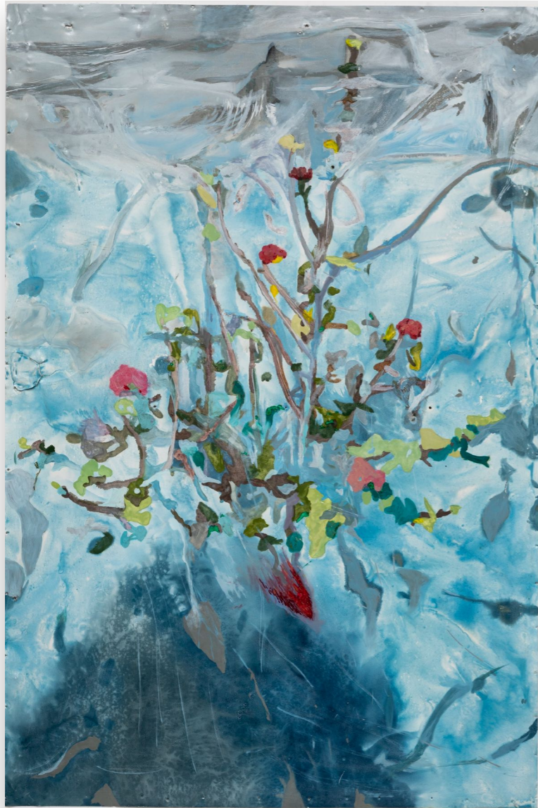
Hermanitas (2022) Esmalte sobre chapas esmaltadas 150 x 100 cm