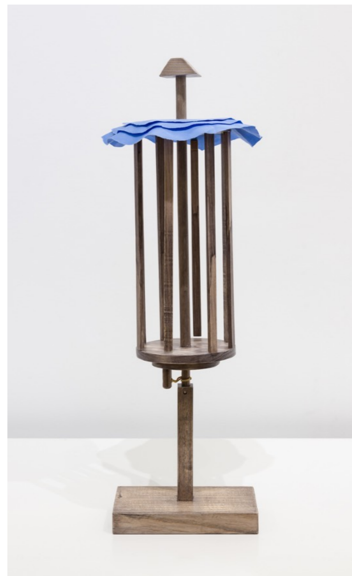
Serie Autómatas Arlequin, 2022 Madera | 54 x 20 cm