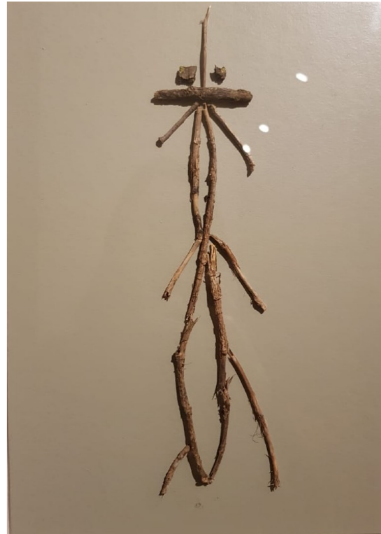
Esqueletos - Bocetos, 2022 Remas sobre papel 42 x 32 cm c/u