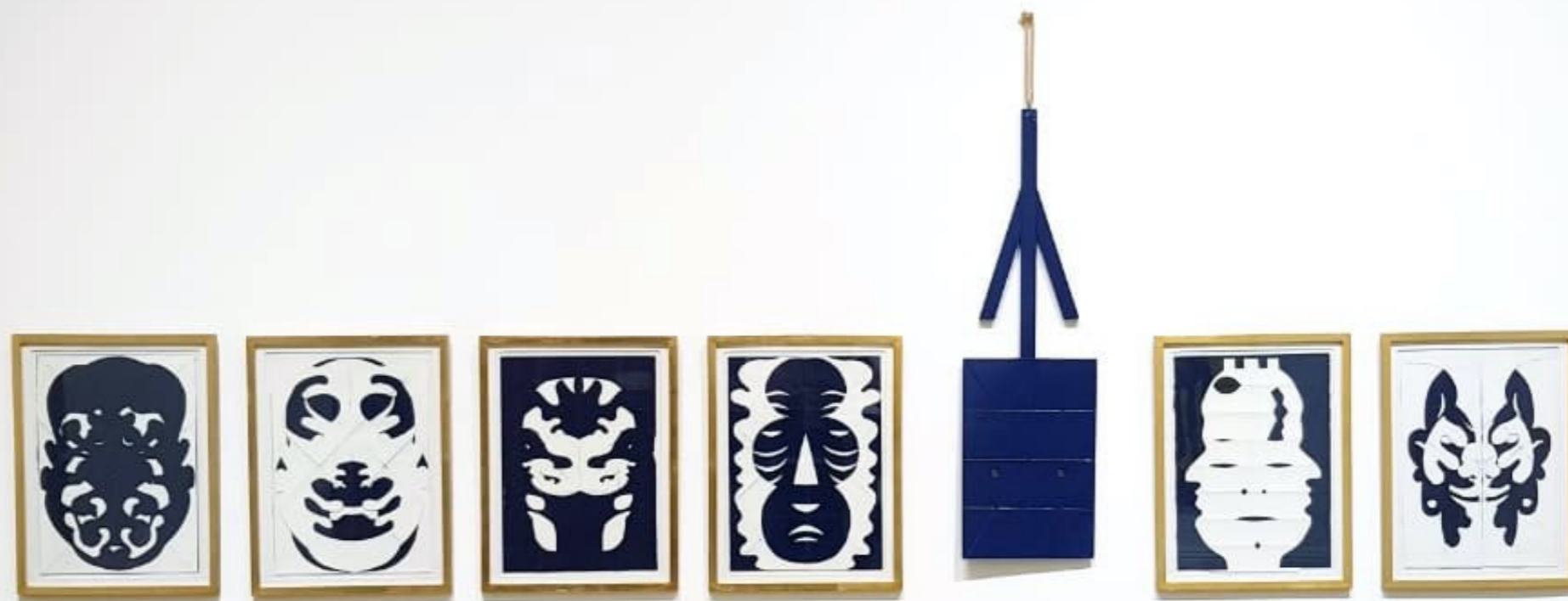
Máscaras, 2020 Acrílico y collage sobre papel 33,5 x 25,5 cm c/u