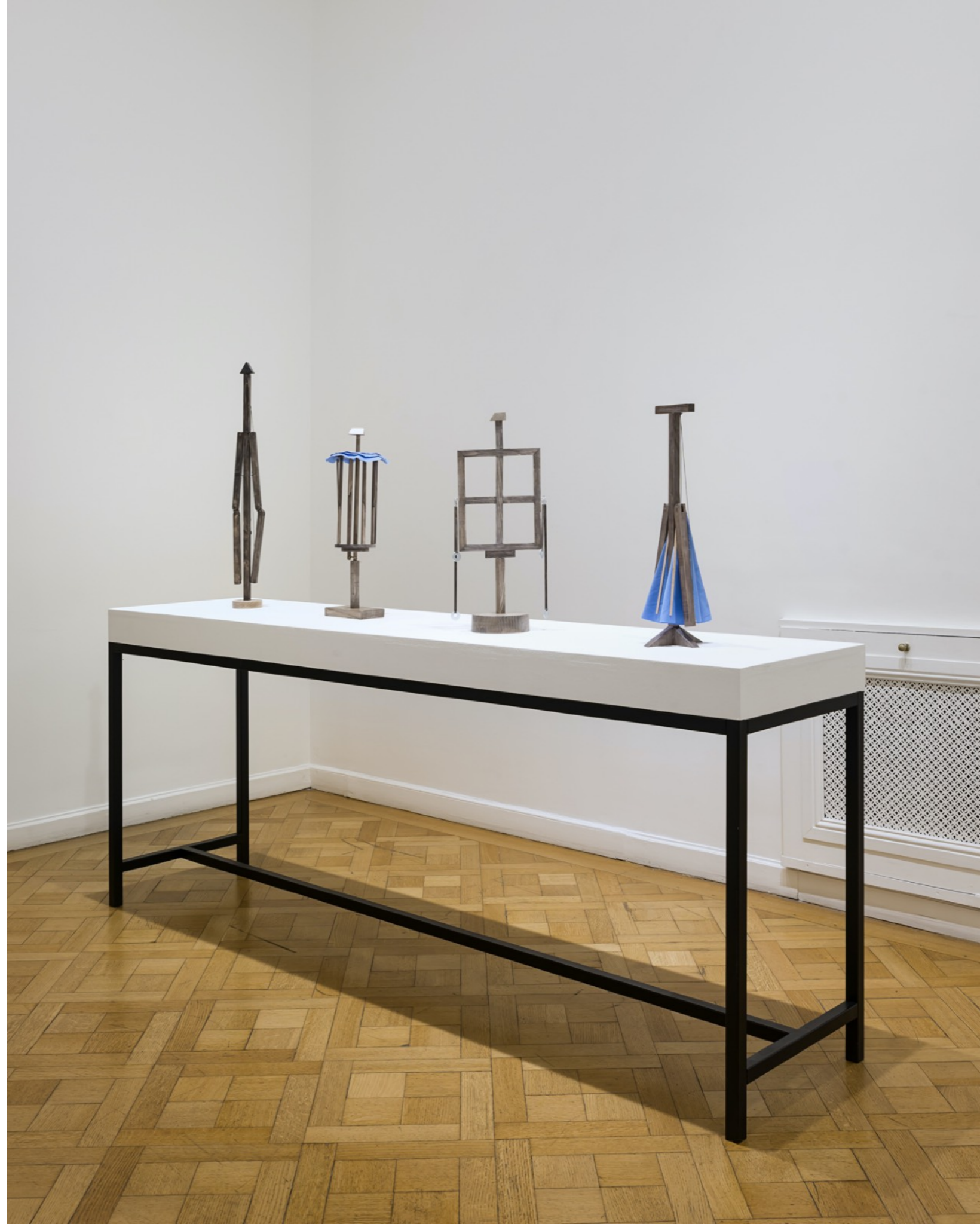
Serie Autómatas, 2022 Madera