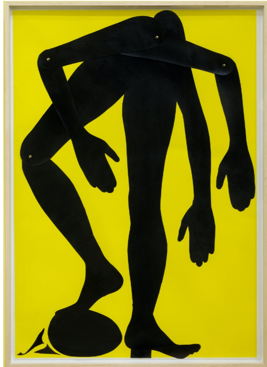
Gorgona 5, 2021 Collage y acrílico sobre papel | 100 x 70 cm