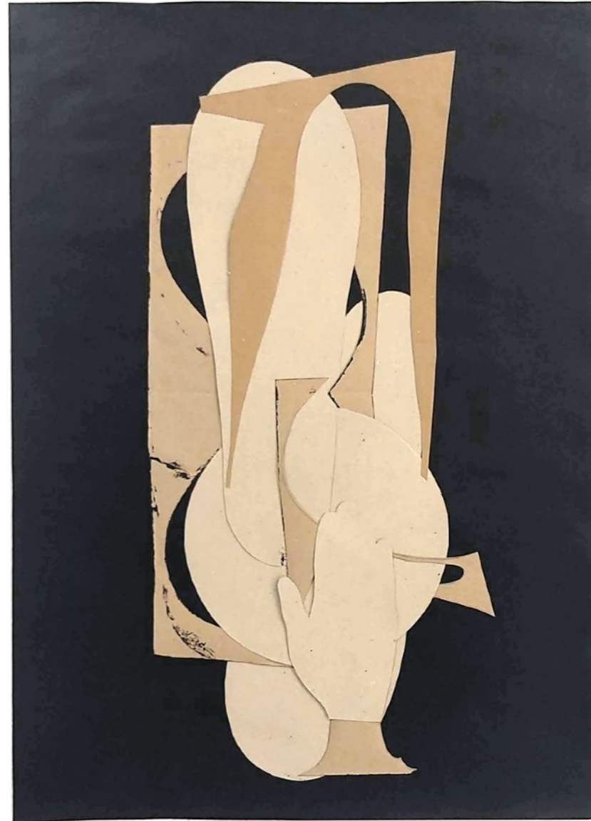
Reconstrucción I , 2022 Collage en papel | 70 x 50 cm