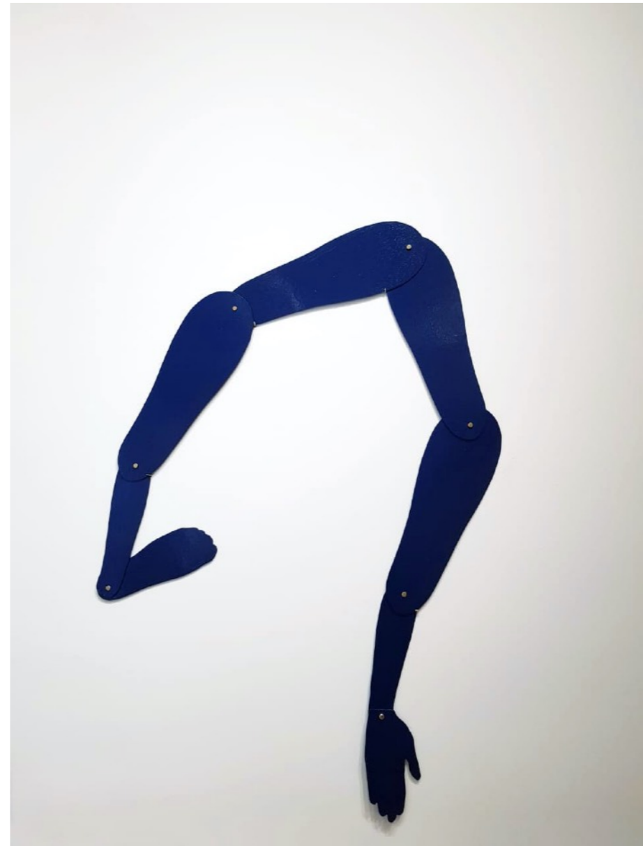
Gorgonas móviles, 2022 Madera y esmalte sintético | medidas variables