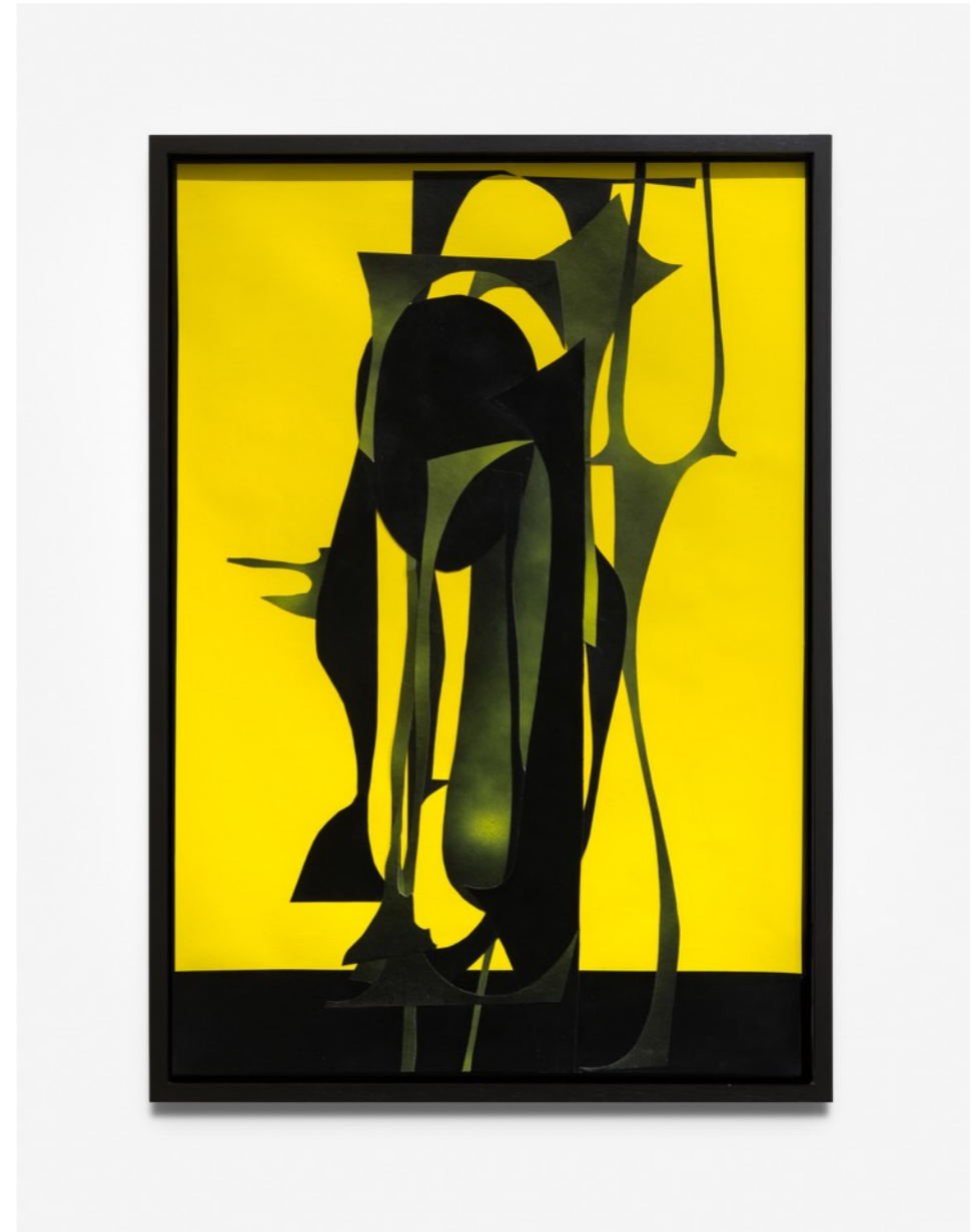
Gorgonas, 2021 Collage y acrílico sobre papel | 70 x 50 cm