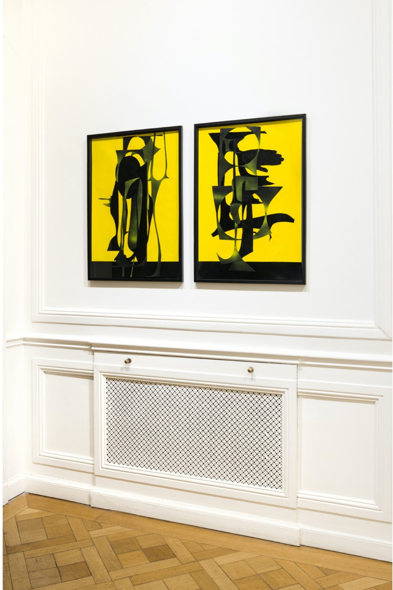
Gorgonas, 2021 Collage y acrílico sobre papel | 70 x 50 cm