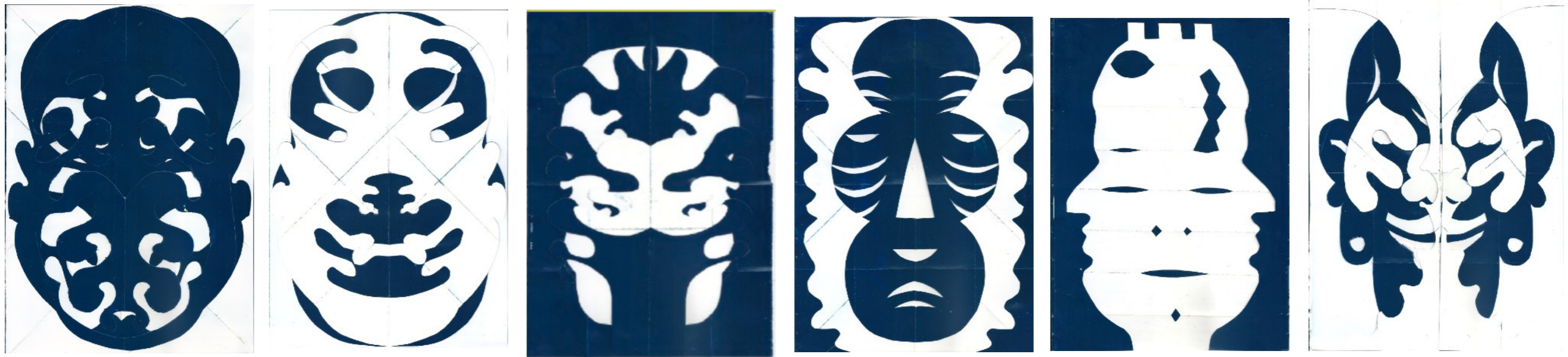
Máscaras, 2020 Acrílico y collage sobre papel 33,5 x 25,5 cm c/u