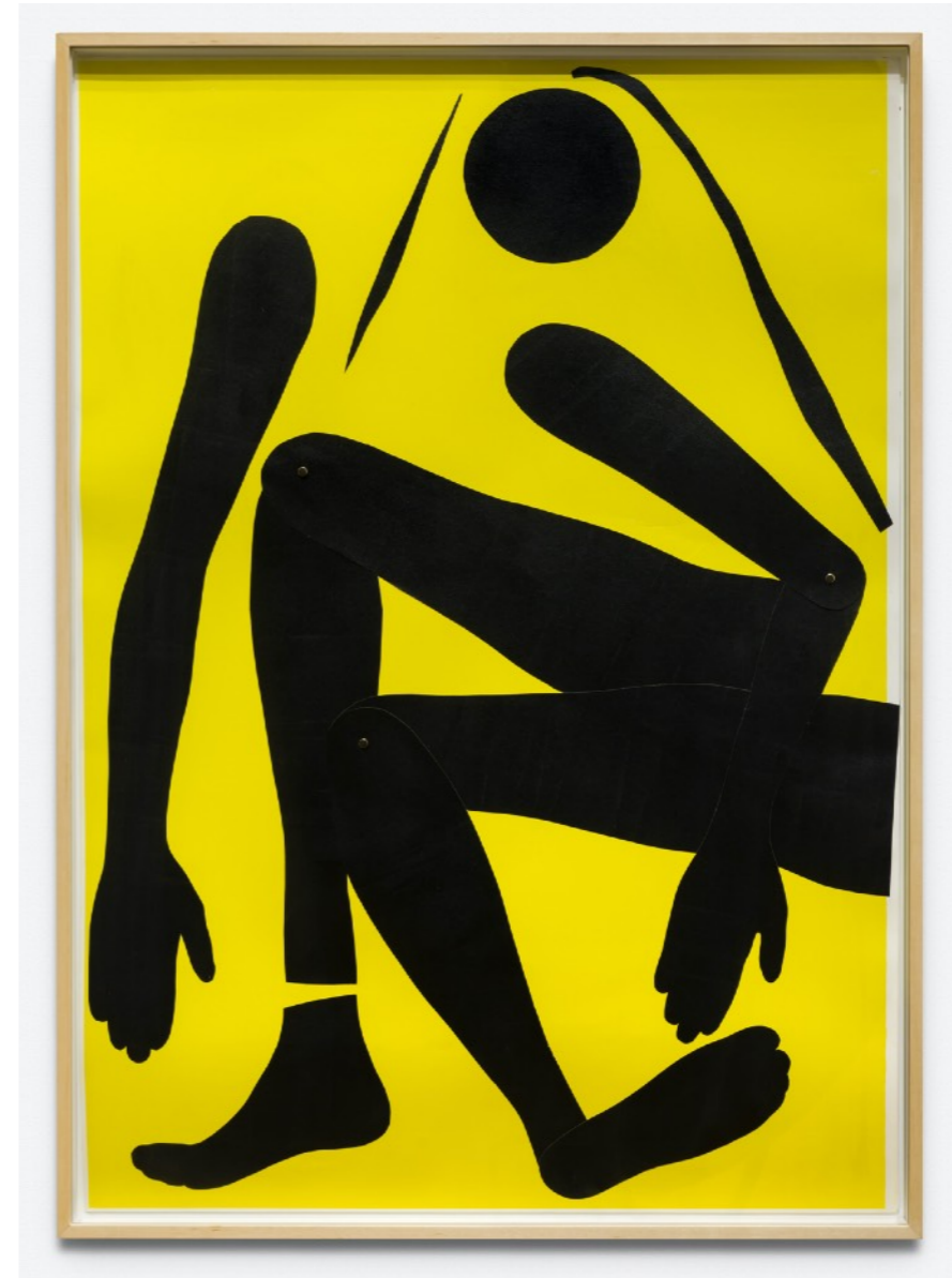
Gorgona 1, 2021 Collage y acrílico sobre papel | 100 x 70 cm