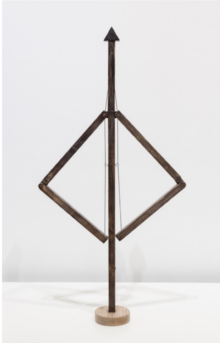
Serie Autómatas Hombre chimenea, 2022 Madera | 75 x 40 cm