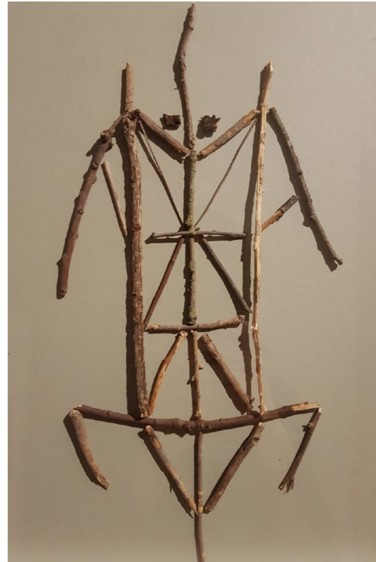
Esqueletos - Bocetos, 2022 42 x 32 cm c/u Remas sobre papel