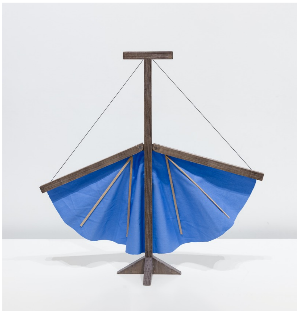
Serie Autómatas Mariposa, 2022 Madera | 54 x 56 cm